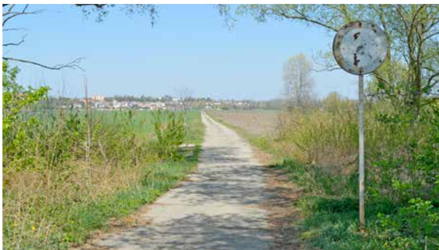
Stávající stav panelové cesty před napojením na ul. Legionářů